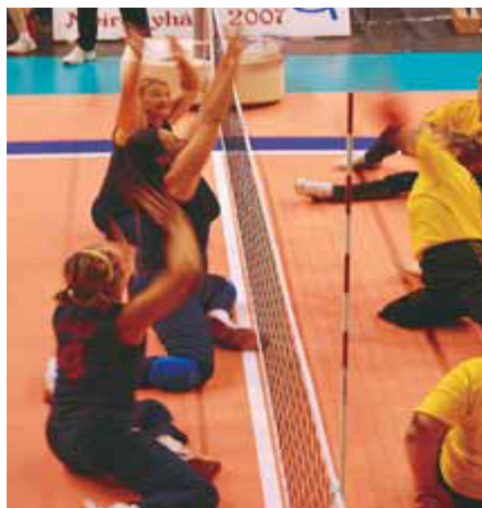
Slika11: Blok pri odbojki sede

Blok je akcija igralcev blizu mreže. Namen bloka je prestreči žogo nasprotnika tako, da igralci sežejo z rokami (dlanmi) čez zgornji rob mreže. Blok lahko izvedejo le igralci prednje, napadalne linije. Libero ne sme blokirati žoge. Če se igralec pri izvajanju bloka žoge ne dotakne, pravimo temu poskus bloka. Dokončani blok pa je takrat ko se igralec v bloku žoge dotakne. Med vrste bloka štejemo tudi kolektivni blok, kateri je izveden z dvema ali največ tremi igralci, ki stojijo tesno skupaj. Kolektivni blok se zaključi, ko se eden od igralcev dotakne žoge. Official Sitting Volleyball rules.