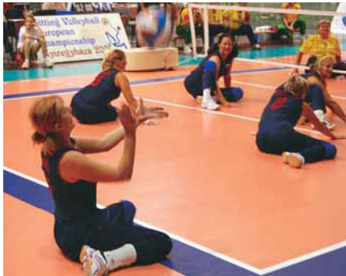
Slika: Servis pri odbojki sede

Servis je začetni udarec, s katerim žogo pošljemo v igro. Začetni servis določi žreb, ki se izvede na začetku prvega niza in na začetku petega odločilnega niza. Pri začetnem udarcu naj bi bila žoga udarjena z eno roko oziroma delom roke, po tem ko je bila predhodno vržena. Samo eden met in eden spust sta dovoljena. Pri servisu se zadnjični del ne sme dotikati servisne črte oziroma se ne sme dotikati igrišča zunaj servisne cone. Okončine se lahko dotikajo igrišča zunaj servisne cone (lahko segajo v igralno cono). Za izvedbo servisa je dovoljenih osem sekund. Po izvedenem servisu se server giba v igralno cono. Če se server pri servisu dvigne od tal, servis ni pravilno izveden. Servisa ni dovoljeno ponavljati (nepravilen izmet žoge), server ima na voljo le en poskus. Official Sitting Volleyball rules.